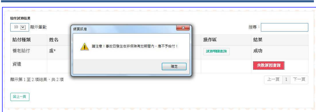
【圖 4-6】保險給付整批試算失敗原因畫面