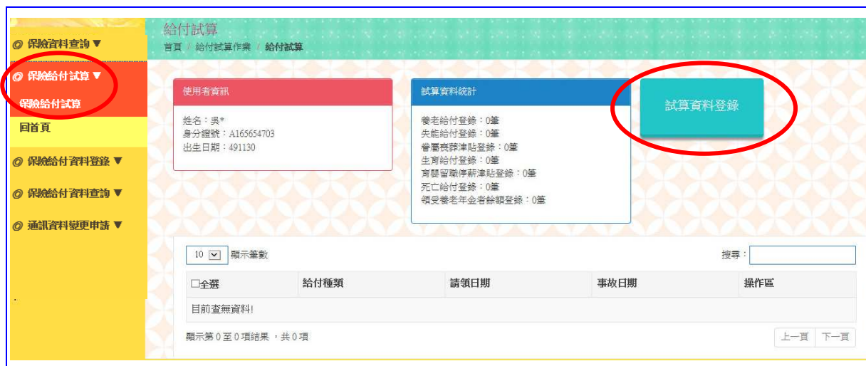
【圖 4-1】保險給付試算資料登錄作業畫面

登入系統首頁→展開 保險給付試算 選單→點選 保險給付試算 按鈕→進入給付試算作業畫面。